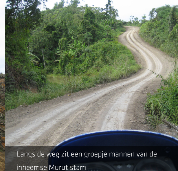
Langs de weg zit een groepje mannen van de inheemse Murut stam