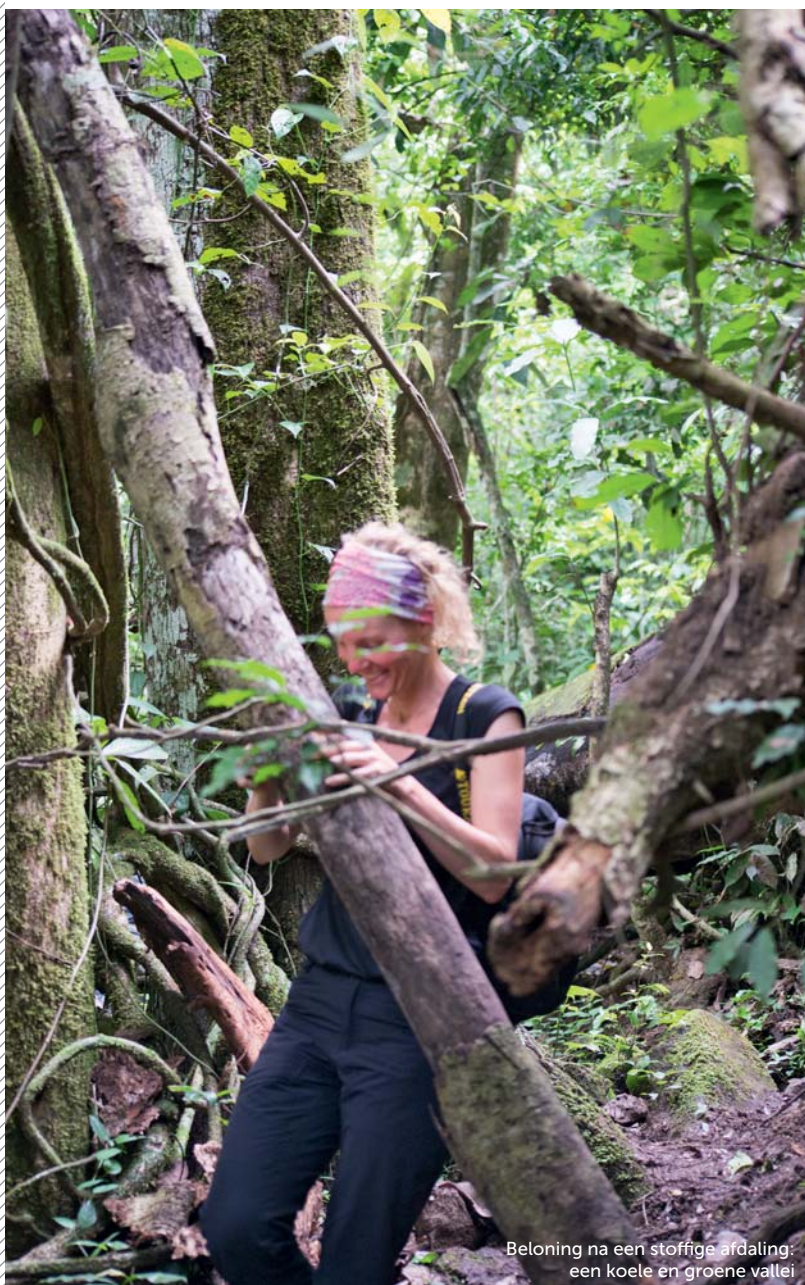
Beloning na een stoffige afdaling: een koele en groene vallei

Gezegend door het vrolijke godvruchtige gezang trekken we binnendoor verder naar Jinja, een slaperig stadje aan de oever van het Victoriameer, het grootste van Afrika.