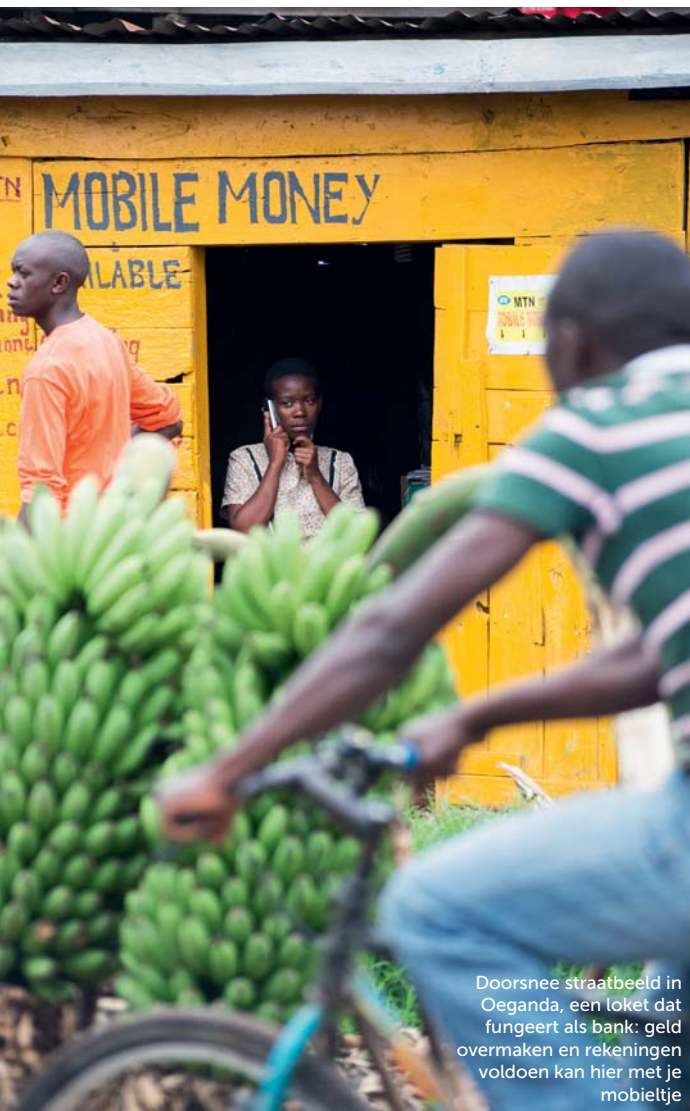
Doorsnee straatbeeld in Oeganda, een toket dat fungeert als bank: geld overmaken en rekeningen voldoen kan hier met je mobieltje