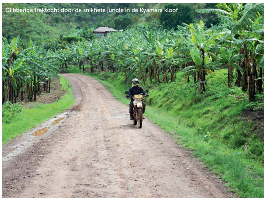
Glibberige trektocht door de snikhete jungle in de Kyamara kloof