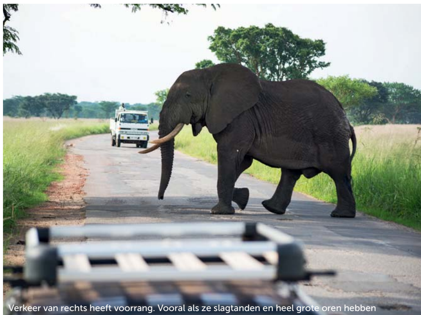
Verkeer van rechts heeft voorrang. Vooral als ze slagranden en heel grote oren hebben