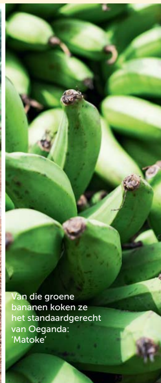
Van die groene bananen koken ze het standaardgerecht van Oeganda: 'Matoke'