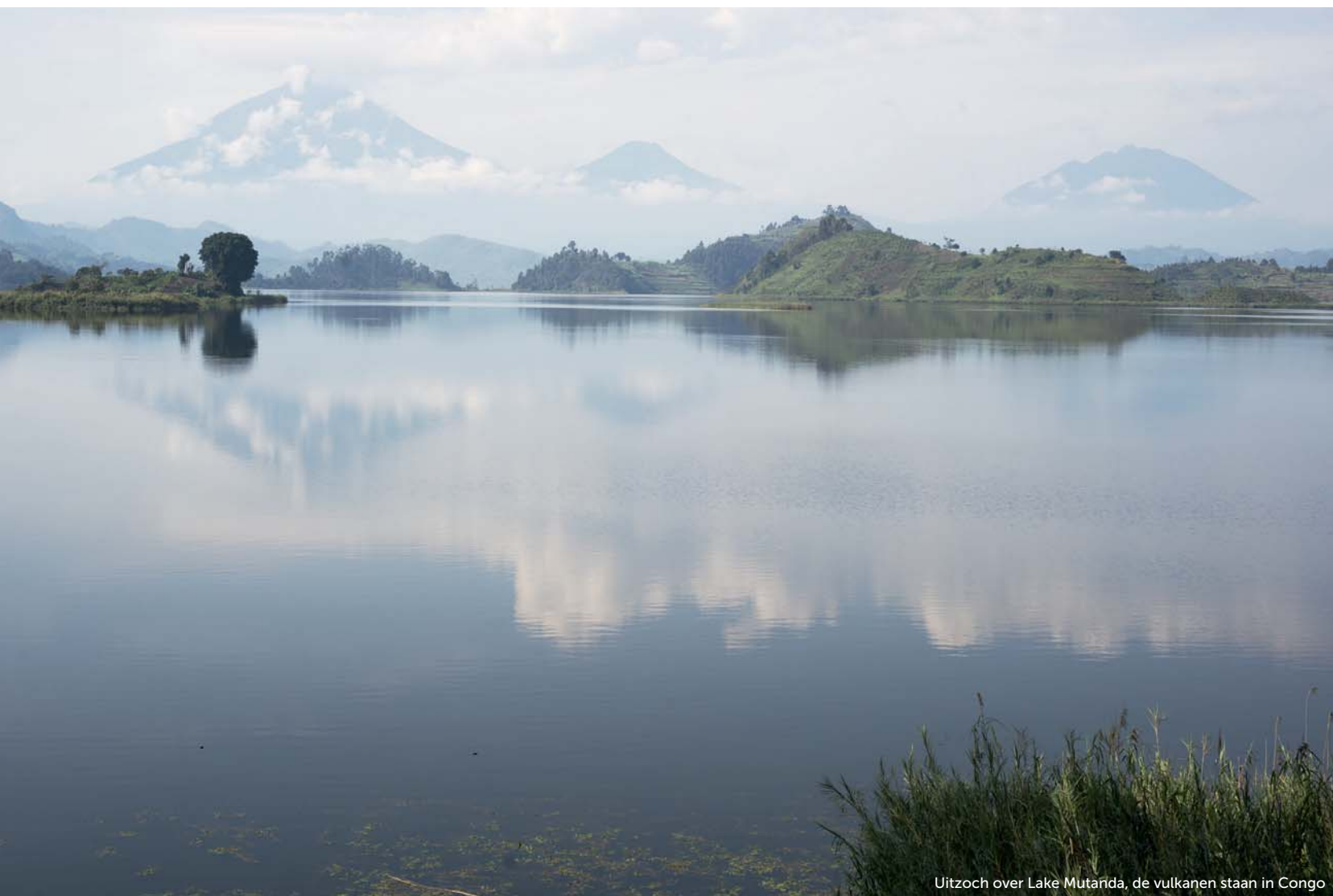
Uitzicht over Lake Mutarida, de vulkanen staan in Congo

Vanuit het haventje maken we een boottocht naar de bron van de Nijl, een borrelend stroompje water dat ontspruit op een klein eilandje. In de verte weerlicht het.