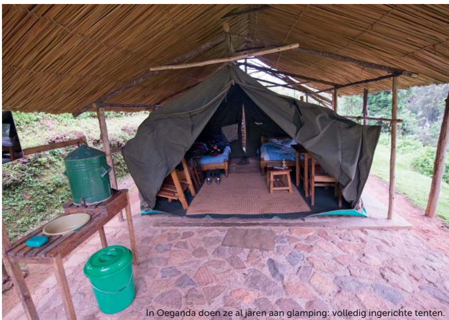
In Oeganda doen ze al jaren aan glamping: volledig ingerichte tenten.