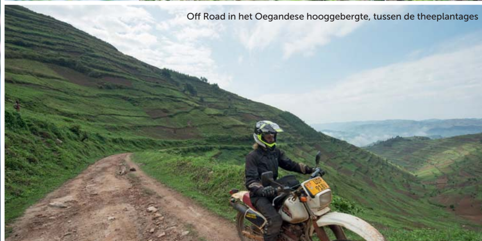
Off Road in het Oegandese hooggebergte, tussen de theeplantages

kodil op, achter hem een hele verzameling soortgenoten die stoïcijns wachten en loeren op een prooi. En vanaf de oevers slaan olifanten, zwijnen en vogels ons gade.